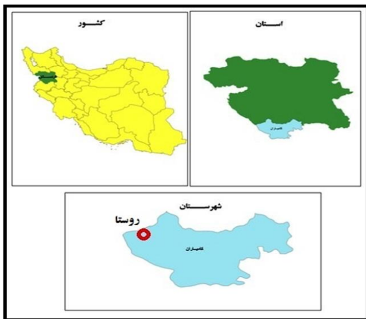
نقشه شماره ۱: موقعیت محدوده مورد مطالعه در سطح کشور، استان و شهرستان

روستا حدود ۵ ماه از سال (از ابتدای اردیبهشت تا آخر شهریور ماه) محل سکونت خود را در روستا به جا گذاشته و در ارتفاعات در محل‌های ییلاقی به نام هوار زندگی می‌کنند.